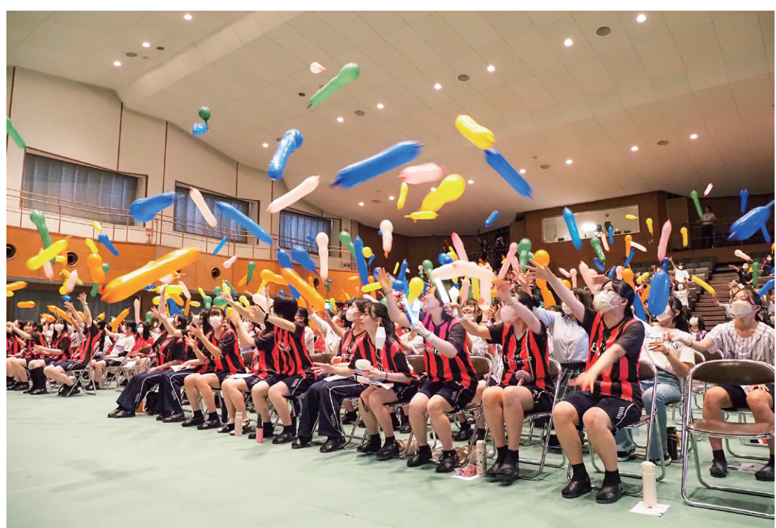
写真1: オープニング恒例のジェット風船は、今年も口ではなく空気入れで膨らませた