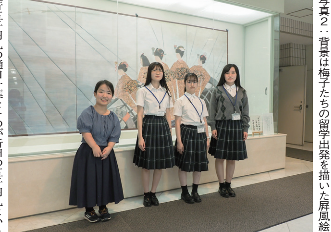
写真2：背景は梅子たちの留学出発を描いた屏風絵

現五千人の肖像に葉を挿入し、両校と二人を繋ぐのは、何と奇遇だ。の新しい五千人の肖像は、何と奇遇だ。