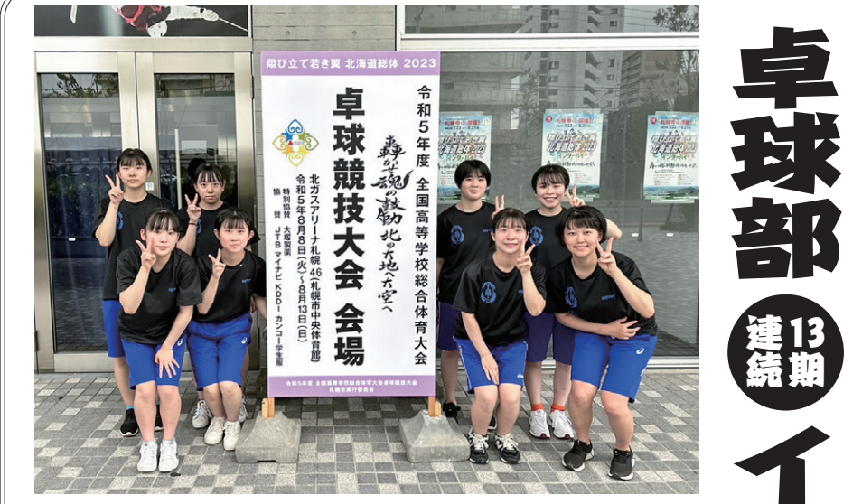
13期連続でインターハイ全国大会出場を果たした卓球部